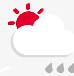
externe Geodaten Services